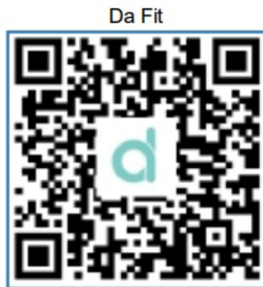
QR kód beolvasása, app letöltése

Olvassa be a következő QR-kódot, töltsse le és telepítse az alkalmazást.